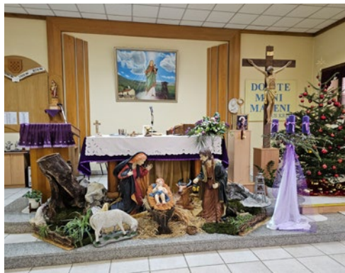
U tijeku je izrada jaslaca u našim Centrima.

Stoga, sretno i blagoslovljeno svima preostalo vrijeme Došašća i svako vam dobro želi, Misija Framost i vaš fratar sa suradnicima.