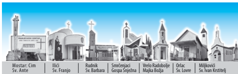
Mostar: Cim Sv. Ante